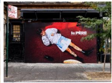
ボンド社による空間デザイン例