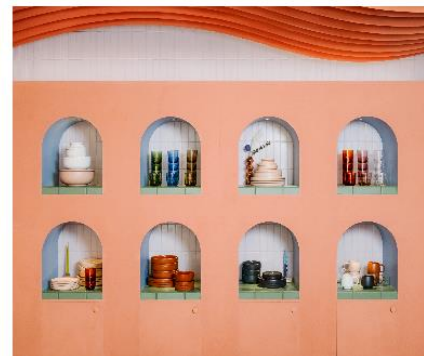
リンゴスタジオ社の空間デザイン例